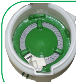
Distribuição de sementes grãos graúdos